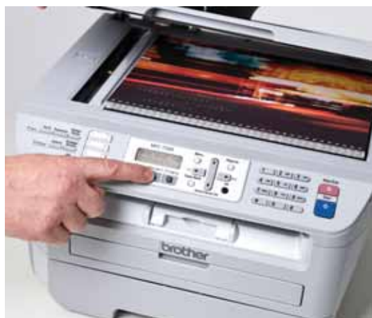
Scansione a colori o monocromatica di qualità.

PC-Fax: consente di scansionare i documenti e di inviarli al pc in formato fax così da evitare la stampa dei documenti. Inoltre, grazie alla guida con gli indirizzi, l'utente può configurare, aggiungere, modificare o cancellare contatti dalla guida.