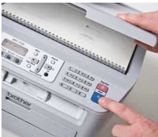
Invia via fax, copia o scansiona i tuoi documenti composti da più pagine.